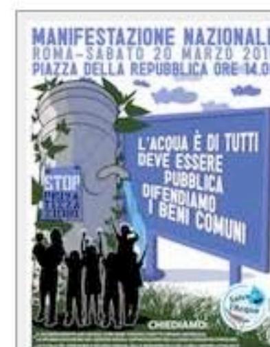
La locandina della manifestazione