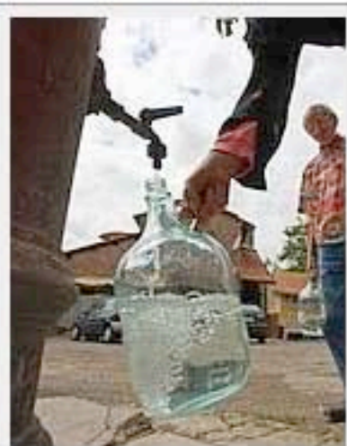
Un romano si rifornisce ad una fontanella pubblica

La Cgil Funzione pubblica: con Acea, Alemanno anticipa di 5 anni il decreto Ronchi, ma nel Lazio è già emergenza