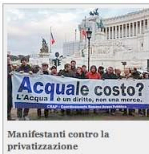
Manifestanti contro la privatizzazione

TARIFFE SU DEL 60 PER CENTO - Oddi spiega che dove l'acqua è stata privatizzata, negli ultimi 10 anni, le tariffe sono aumentate del 60 per cento: «Il triplo rispetto l'inflazione che è stata del 25 per cento, mentre gli investimenti da parte delle aziende nel settore servizi legati all'acqua sono crollati». Come se non bastasse, con una politica economica miope in termini di conservazione e utilizzo delle risorse naturali, «si favorisce la crescita dei consumi, perché significa altri rincari e altri profitti». Legambiente sottolinea che la dotazione minima di acqua per vivere è di circa 50 litri al giorno, «ma a Roma ne consumiamo mediamente 233».